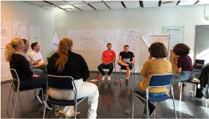
Die Pilot-Trainings wurden in Island, Italien, Österreich, Zypern und Griechenland durchgeführt.