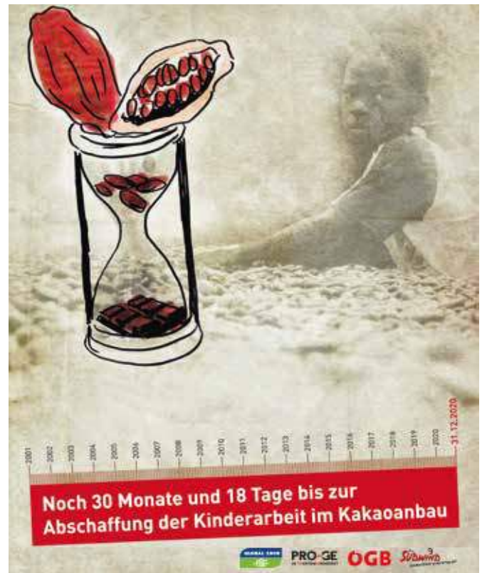
12.6.2017 - Internationaler Tag gegen Kinderarbeit: 2001 haben sich alle großen Schoko-Unternehmen auf das Ende von Kinderarbeit im Kakaoanbau geeinigt. Die Frist dafür läuft am 31.12.2020 aus.

Kinder (wie auch Erwachsene) schleppen bis zu 50-Kilo-Säcke und tragen schwere Wasserbehälter auf dem Kopf. Viele sind von Rückenschmerzen geplagt, werden von giftigen Schlangen attackiert 15 , erleiden Leistenbrüche und manchen Kindern wächst ein Buckel. Sie verletzen sich mit Macheten und anderen Erntegeräten, was zu gefährlichen Infekti-