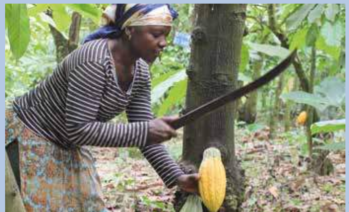
Kakaobäuerin auf ihrer Farm in Kamerun

Mit etwa 70% stammt der Großteil des weltweit hergestellten Kakao aus den vier westafrikanischen Ländern Elfenbeinküste, Ghana, Nigeria und Kamerun. 4 Dort liegt der Kakaoanbau zu 80 - 90% in den Händen von Kleinbäuerinnen und -bauern, mit einer durchschnittlichen Farmgröße von 2 – 4 Hektar. 5