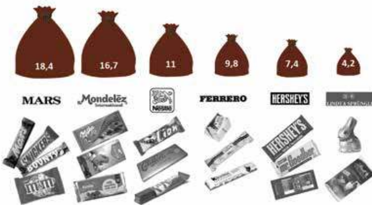
Anteil am weltweiten Umsatz des Süßwaren- und Schokoladenmarktes (in Prozent, 2015) 11

Konzerne fast 70% des Marktes beherrschen. Und auch bei den Supermarktketten ist eine Konzentration feststellbar. So kontrollieren beispielsweise in Österreich drei Handelsketten (REWE, Spar, Hofer) ca. 85% des Marktes. Aufgrund des steigenden Anteils von Eigenmarken-Schokoladenprodukte trägt auch die Konzentration im Einzelhandel zu einer zunehmenden Abhängigkeit der ProduzentInnen bei. 10