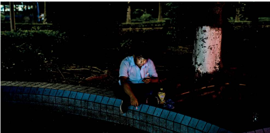
Junge Studierende sind unersetzbar billige Arbeitskräfte für Chinas Elektronikindustrie.

Das Problem mit dem Missbrauch der Praktika ist komplex und strukturell bedingt, wie Liang zugibt, und viele Akteure sind beteiligt. Doch wäre die „Komplexität“ mittlerweile eine billige Ausrede, die zu oft von Markenherstellern benutzt worden sei, um den Status quo aufrechtzuerhalten. „Die lokalen Behörden sind auf Investitionen angewiesen. Lieferanten und Markenhersteller könnten durchaus Druck auf die lokalen Behörden und Schulen ausüben, damit die Gesetze genau eingehalten werden, falls sie das wirklich wollten: die Macht dazu hätten sie. Geld regiert die Welt, und die Regierung mag vielleicht darüber hinwegsehen, dass die Rechte von Praktikanten verletzt werden, aber sie würde zweifellos nichts dagegen haben, wenn die Unternehmen ihre Beschäftigten endlich korrekt behandeln würden“, ist sich Pui Kwan Liang sicher.