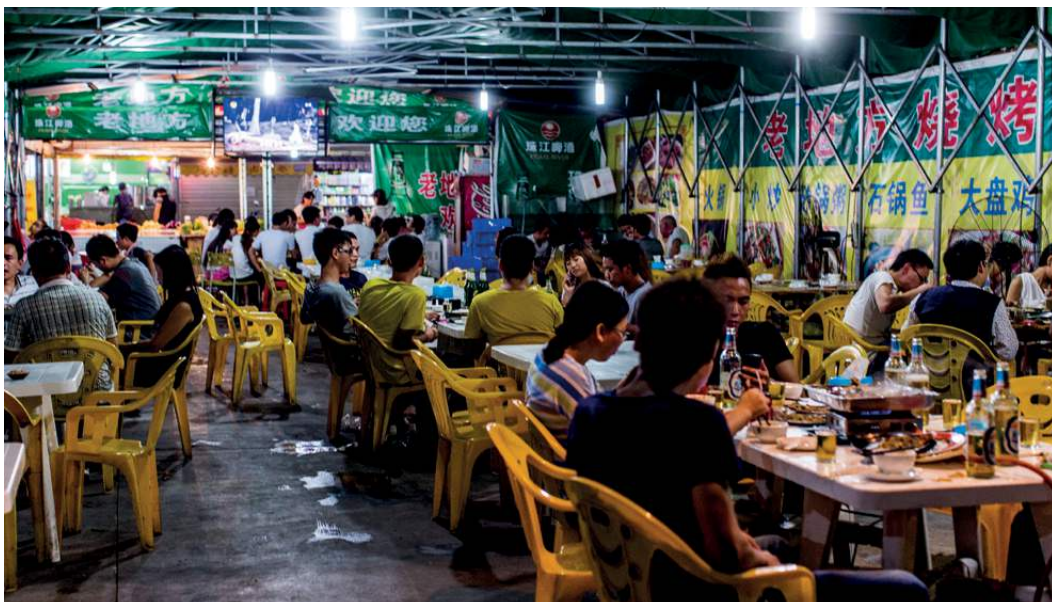
PraktikantInnen und ArbeiterInnen genießen ihre spärliche Freizeit.

„Dem Text nach sorgt das Gesetz für einen guten Schutz, aber die Umsetzung der Vorschriften durch die lokalen Behörden ist sehr schlecht.“