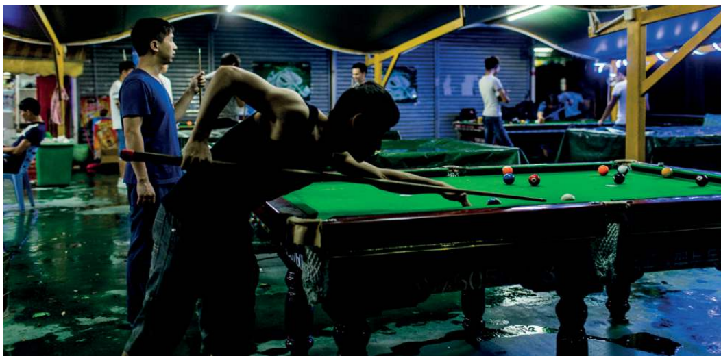
Pool-Tische im Erholungsbereich außerhalb der Wistron-Fabrik

„Wir arbeiten am Wochenende, weil die Stammebelegschaft auf Urlaub ist und wir sie ersetzen müssen“, erklärte sie.