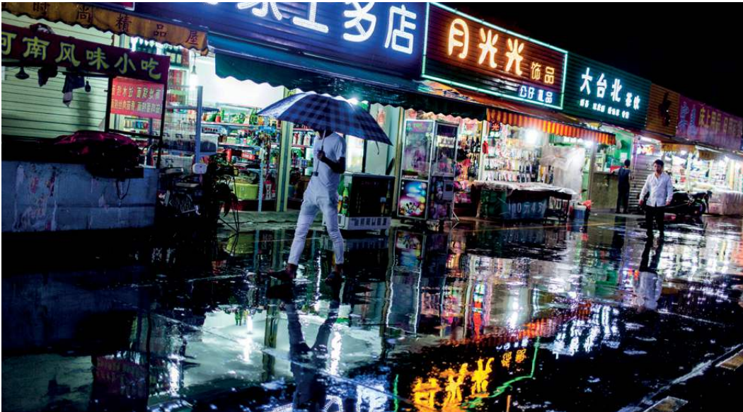
Die Geschäfte und Restaurants außerhalb des Wistron-Geländes decken die Grundbedürfnisse der Beschäftigten ab.

Elaine Sioleng Hui glaubt, dass öffentliche Beschaffungsstellen in Europa einen positiven Beitrag zum besseren Schutz der ArbeiterInnenrechte in China leisten können. Sie hält es aber für sehr wichtig, dass sich öffentliche Institutionen der Schwächen von CSR bewusst sind, insbesondere im Hinblick auf durchsetzbare Regeln und Verantwortlichkeiten. „Verhaltenskodexe, UNGP und CSR-Programme sind ‚Soft Law‘. Wenn man sie nur mangelhaft befolgt oder sich gar nicht daran hält, wird niemand bestraft, weder die Unternehmen noch die öffentlichen Auftraggeber“, erläutert Hui. Hui und K.C. Chan kommen in ihrer Analyse zum Schluss, dass „Soft Law“ ein effektives Mittel geworden ist, um gesetzliche Verpflichtungen zu vermeiden und/oder zu verringern.