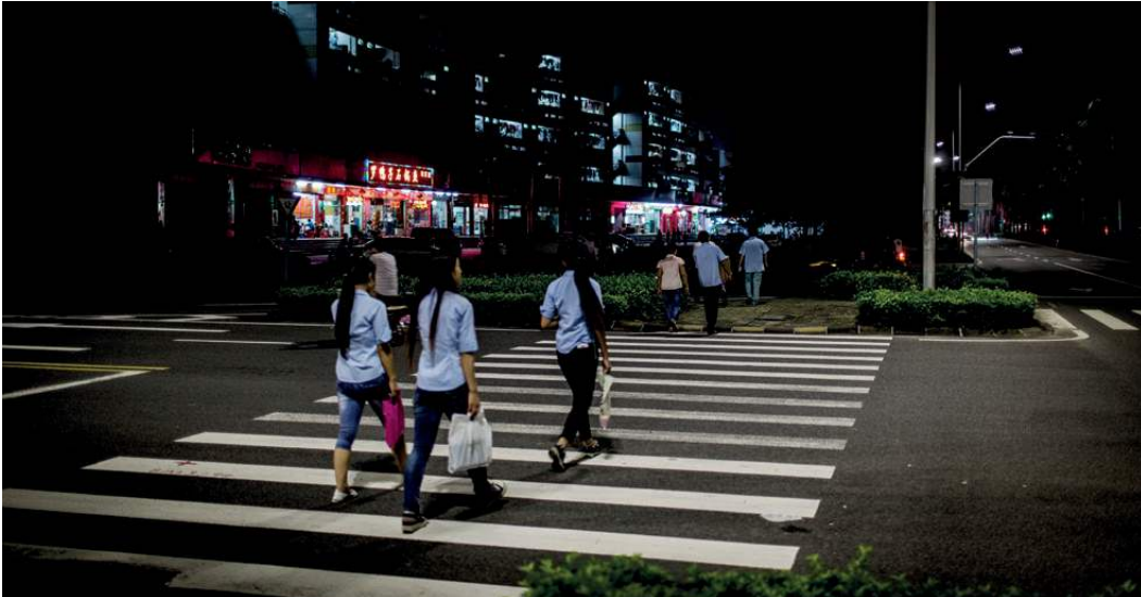
Nach 12 Stunden Schichtarbeit gehen Studierende zurück in ihr Wohnheim.

Tatsächlich sind die PraktikantInnen auch deshalb in einer eher prekären Situation, da sie „streng genommen keine Arbeitnehmer sind“ und daher auch nicht die Rechte von regulären Beschäftigten genießen, wie Crothall weiter ausführt: