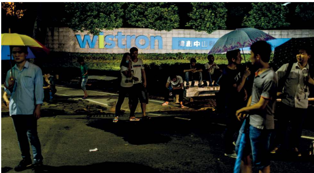
ArbeiterInnen verlassen um 8 Uhr abends die Wistron-Fabrik

DanWatch hat die Lieferkette von Servern, die an europäischen Universitäten eingesetzt werden, bis zu den Fertigungslinien der Wistron Corporation in Zhongshan verfolgt. Dort werden Server für HP, Dell und Lenovo hergestellt. DanWatch interviewte 25 PraktikantInnen. Neun von ihnen gaben gegenüber DanWatch an, von ihren Schulen zu diesen Praktika gezwungen worden zu sein: Man drohte ihnen, sie durchfallen zu lassen, wenn sie die Arbeit bei Wistron verweigerten.