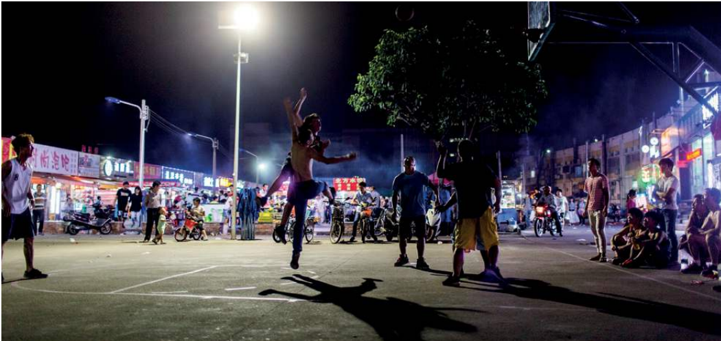
Täglich treffen sich ab 8 Uhr abends junge Männer für ein Basketball-Match außerhalb des Wistron-Geländes.

rechte im gesamten Beschaffungsprozess berücksichtigen müssen, angefangen von der Festlegung gesetzlicher Regeln und Grundsätze für die Beschaffung über Planung, Risikobewertung und Ausschreibung bis hin zu Monitoring und Überprüfung“.